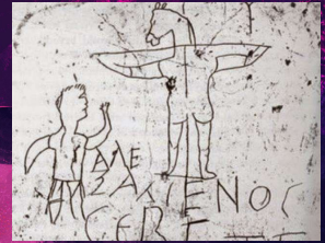
Grafito de Alexámenes: "Alexámenes adorando a su dios"